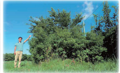
植樹して3年後に撮影した様子