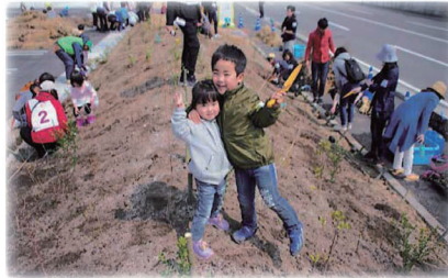
植樹祭で植えられた木々 (高さ約50cm) と子供達の笑顔

岩手県大槌町吉里吉里地区・天照御祖神社の鎮守の森 (平成23年3月18日米軍撮影) U.S.Navy photo by Mass Communication Specialist 3rd Class Dylan McCord