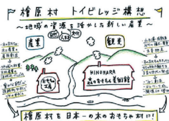
トイビレッジ構想