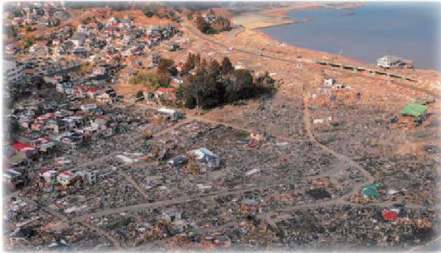
東日本大震災の津波で残った“鎮守の森”

私自身、森の機能は「景観・生態・防災」の3つに大別されると考えており、特に防災については東日本大震災の後に“鎮守の森”が津波から残された姿を見ると、在来種の可能性を感じると共に今後の街づくりにも応用する必要があると思っています。また、現在の森林の多くを占めている人工林に関しては林業施業が行き届かない場所が散見されます。このような人工林を在来種の森林に変えることで災害にも強く、生物多様性にも貢献することができます。日本だけでなくヨルダン、フランス、インド、中国などで森づくりの指導をしてきた私自身の経験も活かして、日本に“森の設計士 (Forest Architect)”という新しい職業を生み出し、森林全体を活用してビジネスと生態系を循環させる“森林業”を確立することで、日本が本当の意味での森林大国になると考えています。